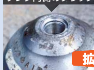
タンク内側のクラック